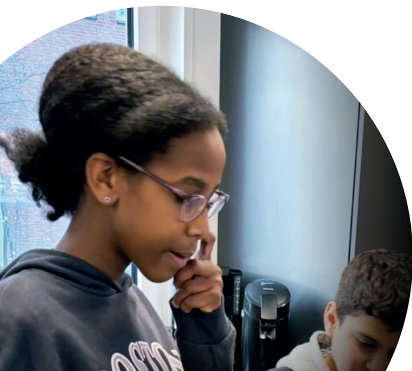
Rufta onze jongste vrijwilligster

Neem dan op korte termijn contact met ons op via info@onsvenlo-oost.nl